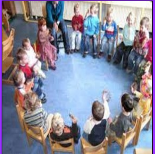
in de kring