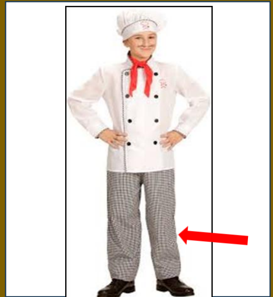
de geruite broek