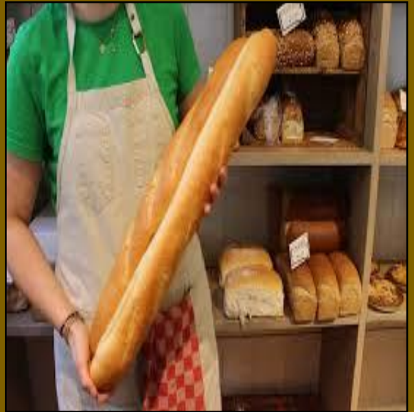
● het stokbrood