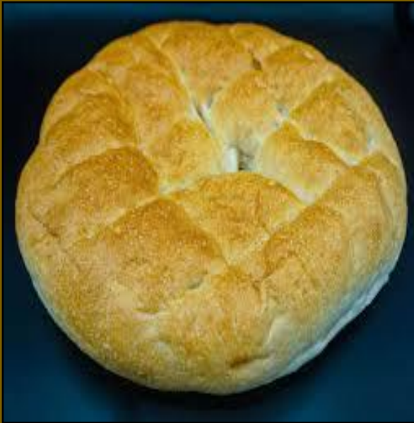
● het Turks brood